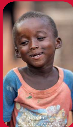
Amref France - Karozenphotographe

Dans le cadre de notre programme « Cellal e Kisal » pour la santé maternelle, néo-natale et infantile, L'Organisation Internationale de la Francophonie (OIF) s'est engagée à soutenir un volet sur la sensibilisation aux bonnes pratiques nutritives. Ce projet de 8 mois contribue à l'autonomie et la résilience des femmes aux crises sanitaires en renforçant la réalisation de leur droit à la santé. Il a pour objectif spécifique de réduire les conséquences de la crise sur la santé reproductive et l'état nutritionnel des femmes et de leurs foyers, en formant un groupe de 100 femmes à la production d'aliments à haute valeur nutritionnelle.