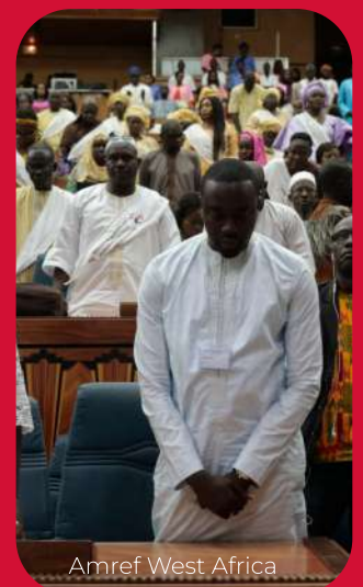
Amref West Africa