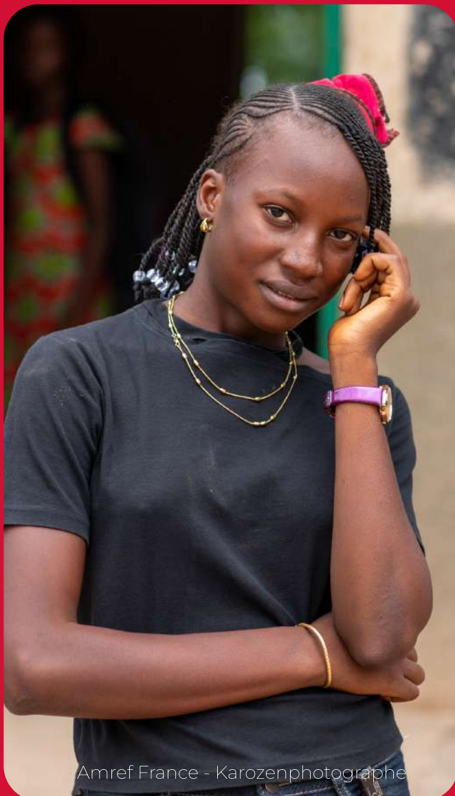
Amref France - Karozenphotographe

Or, dans beaucoup de pays africains, les normes socio-culturelles pèsent sur la population féminine dès le plus jeune âge. Ainsi, les filles et les garçons ne vivent pas selon les mêmes réalités. Amref mène des programmes pour réduire ces écarts et donner la même chance à tous et toutes de vivre en bonne santé à tout âge. Son objectif est d'accompagner des changements profonds et progressifs pour renforcer la prévention des Violences Basées sur le Genre (VBG).