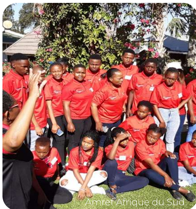
Amref Afrique du Sud

dialogues communautaires ont été organisés sur la santé scolaire