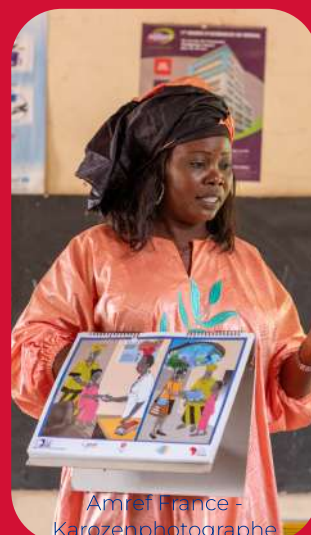
Amref France - Karozenphotographe

Le projet Capital Santé se renouvelle grâce au soutien de la Coopération Monégasque. Il intervient dans la région de Kolda au Sénégal. Ce projet a pour objectif global de contribuer à réduire la morbidité et la mortalité des enfants (0 à 14 ans) de la région casamançaise, particulièrement ceux du District Sanitaire de Kolda, en leur offrant un capital santé optimal à travers l'engagement et l'interrelation de 3 environnements à savoir l'école, la communauté et les services de santé. Présent dans 20 écoles, le projet se poursuivra jusqu'en février 2023.